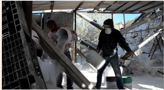
Figura 4. Las fotografías muestran la zona de extracción artesanal de calcita, A) Visualización de maquinaria improvisada como armazones (uso de contenedores metálicos de 200 L como tolvas), fotografía tomada por: Ing. Francisca Monge Amaya, integrante de FAMA; y B) Mineros Artesanales de la Cantera “Las Minitas”. En la fotografía se puede apreciar la falta de equipo de seguridad y materiales de trabajo adecuados, lo cual evidencia las carencias que se tienen para la extracción. Fotografía tomada por: Lic. Narciso Navarro Gómez, colaborador de FAMA.

En el sitio existen algunas obras viejas conocidas como las minitas del cerro “El Apache” donde en décadas pasadas, hubo extracción de minerales de tungsteno como la scheelita, la cual durante la segunda guerra mundial fue vendida a Estados Unidos de América [6]. Esas pequeñas obras mineras se encuentran expuestas y constituyen un factor de riesgo.