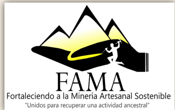
Figura 2. Representación del logotipo de Fortaleciendo a la Minería Artesanal Sostenible, un proyecto del Banco de Proyectos de SDSN México, ver en: https://sdsnmexico.mx/banco-de-proyectos/comunidades-sostenibles-y-bienestar-social/fortaleciendo-la-mineria-artesanal-sostenible/ .

ecisiete, relacionado con Alianzas para lograr los objetivos: construcción de cadenas de colaboración con instituciones académicas, laboratorios, sector público y privado.