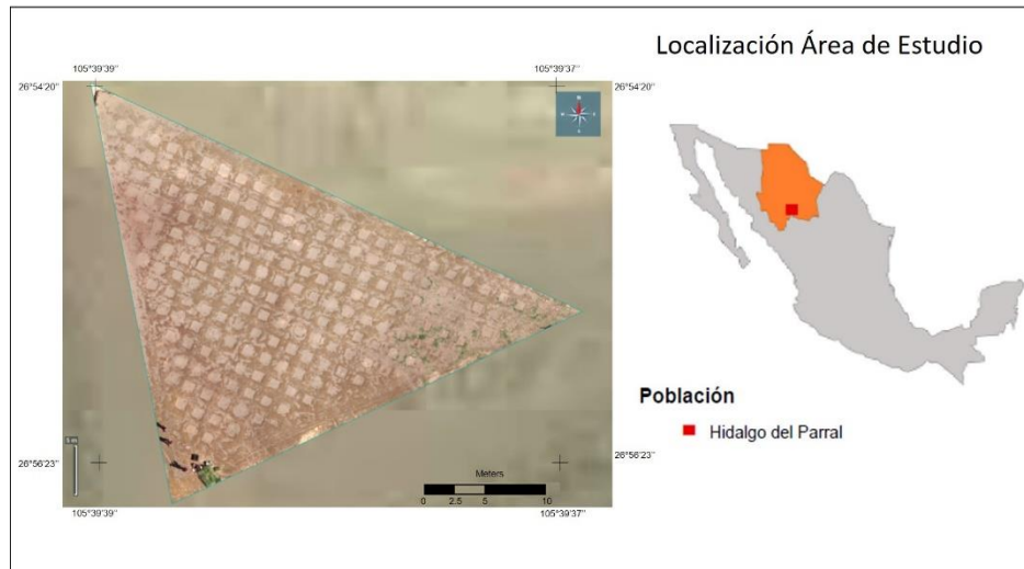
Figura 1. Localización del área de estudio con la distribución de parcelas.

El clima en la región se identifica como un clima semi-seco o semiárido, cuyas lluvias se presentan durante el verano en un promedio de 72 días y una humedad relativa de 48%. La precipitación media anual calculada es de 456.7 mm, considerando los años 2019 y 2020, que abarcaron el periodo de aplicación del experimento, como dos años consecutivos con lluvias por debajo del promedio, con 260 mm para el 2020 [19]. La vegetación está constituida mayormente por pastizal y en menor proporción por matorral, bosque y mezquital [20].