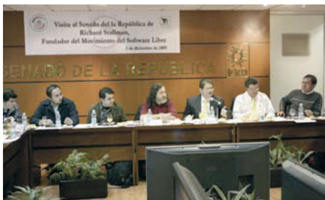
Figura.2. Richard Stallman en su visita a la Cámara de Senadores de México.

En el mejor de los casos, el estudiante podría desarrollar sus propias herramientas computacionales para generar y difundir su conocimiento en el marco del movimiento del Software Libre. Ahora podemos apreciar la importancia de la adopción de Software Libre por parte de las instituciones educativas.